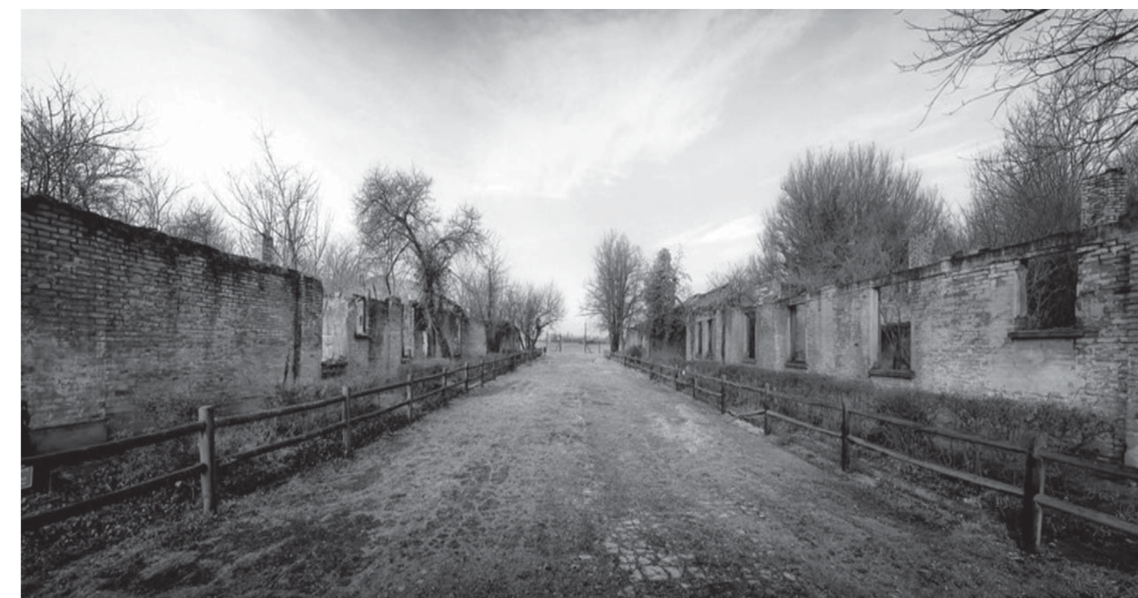
Campo di Fossoli, 2013