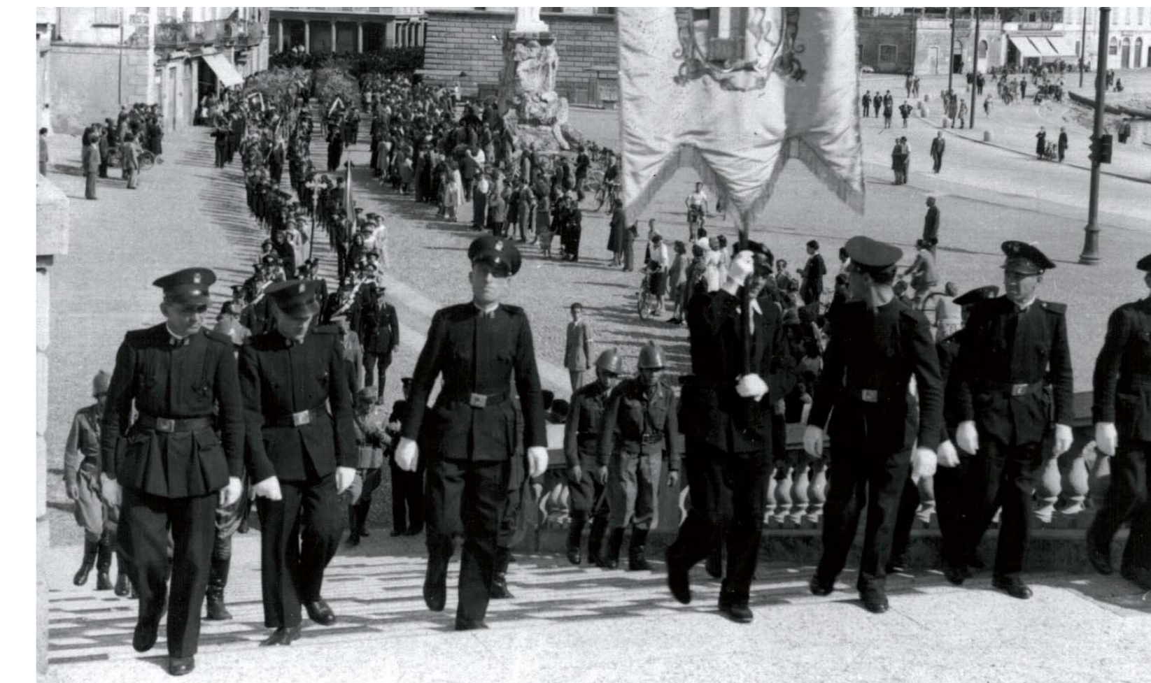
Funerali cittadini al Monumentale

L'eccidio, anomalo per la cura con cui ne sono stati occultati i motivi, non ha ancora avuto giustizia né è stato chiarito in tutte le sue cause. "Le indagini sulle strage si sono susseguite, sovrapposte, bloccate e infine arestate per un cinquantennio in una girandola di istruttorie e archiviazioni disposte dalla Special Investigation Branch britannica e da quella statunitense, dal Tribunale Supremo del Regno (e poi della Repubblica) d'Italia, dalla Procura militare di Bologna e da quella di La Spezia, nonché dalla magistratura tedesca". Mimmo Franzinelli "Le stragi nascoste"