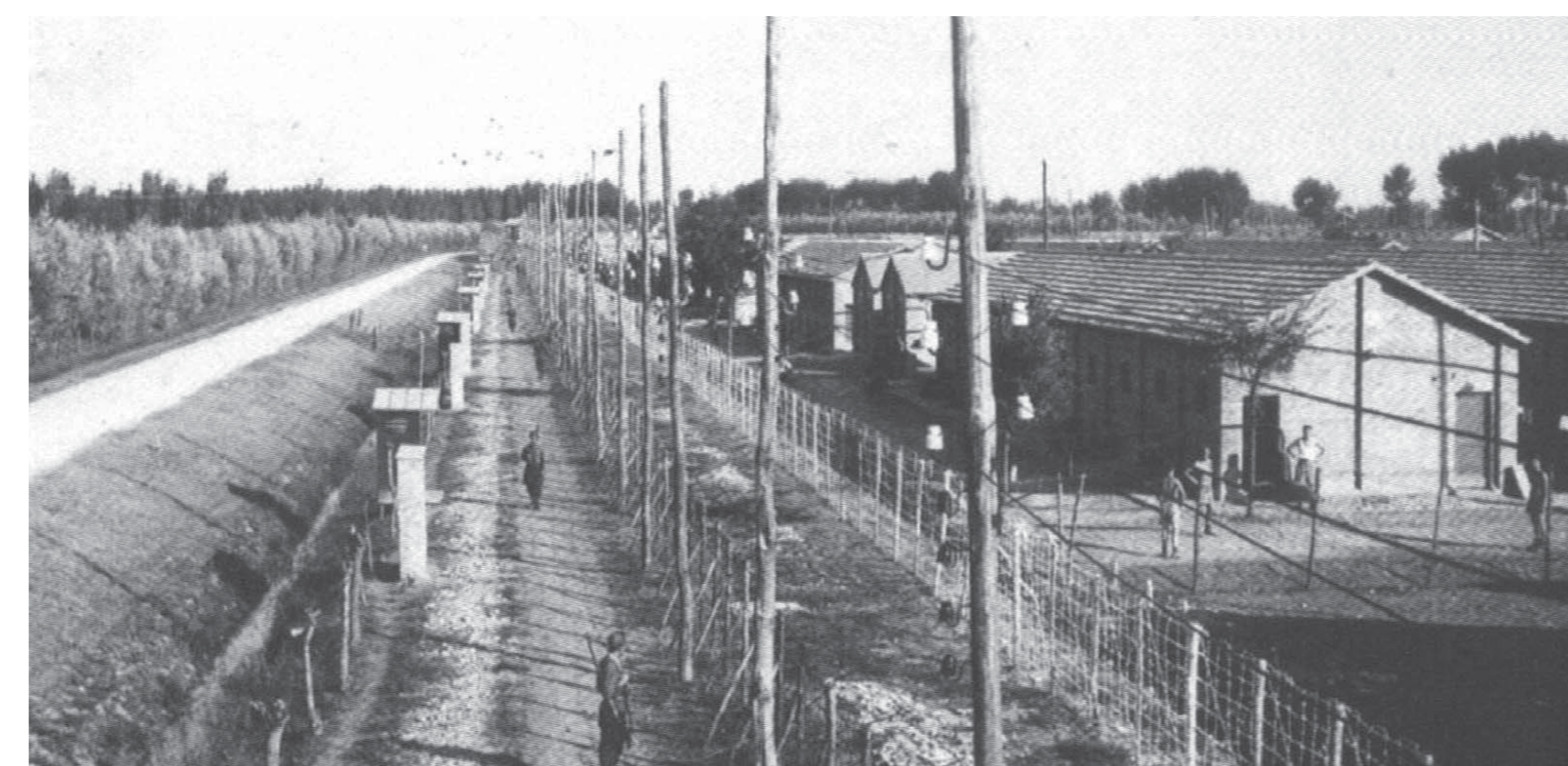
Campo di Fossoli, 1943