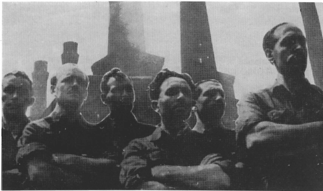
Braccia incrociate anche nelle officine lecchesi a sfida verso l'oppressore nazifascista.