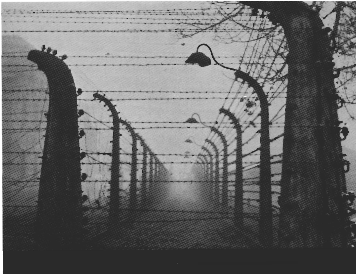
Il reticolato di Auschwitz, in Polonia, dove furono deportate le donne leccesi.

Il suo cadavere venne ritrovato fra quelli dei martiri di Fossoli, fucilati nel luglio 1944.